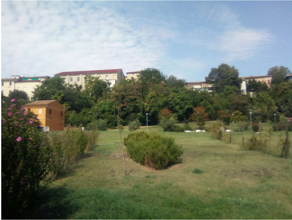
Figura 5: AREA A