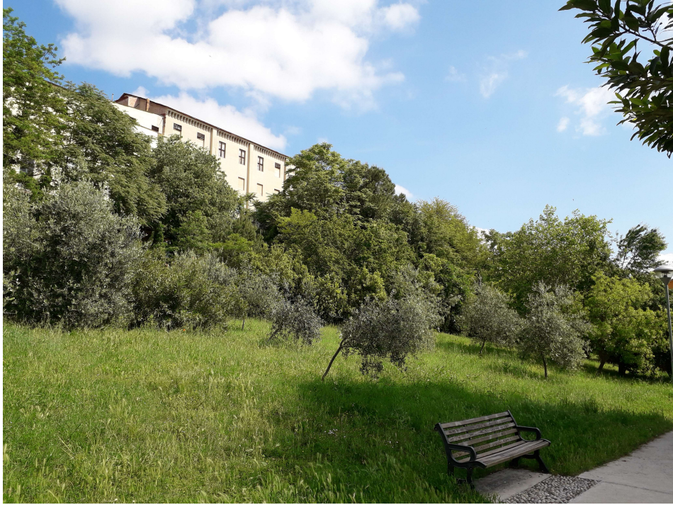
Figura 3: AREA A