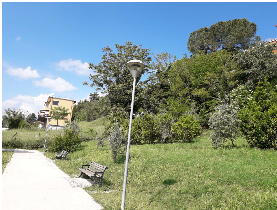
Figura 1: AREA A