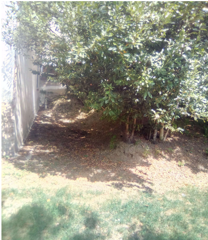
Figura 13: AREA B