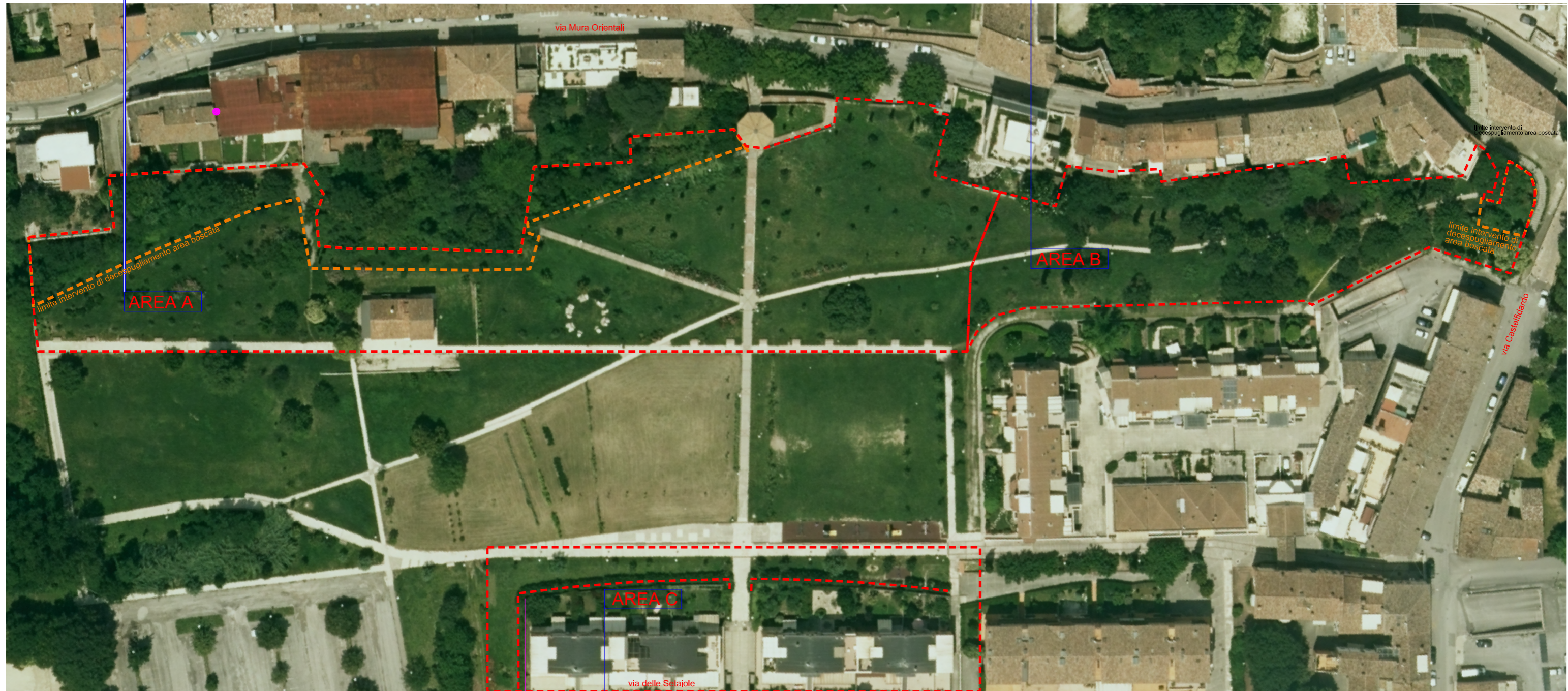
Planimetria di localizzazione interventi.