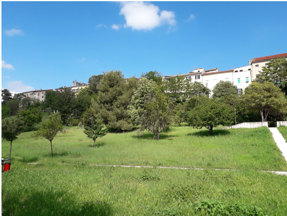
Figura 4: AREA A