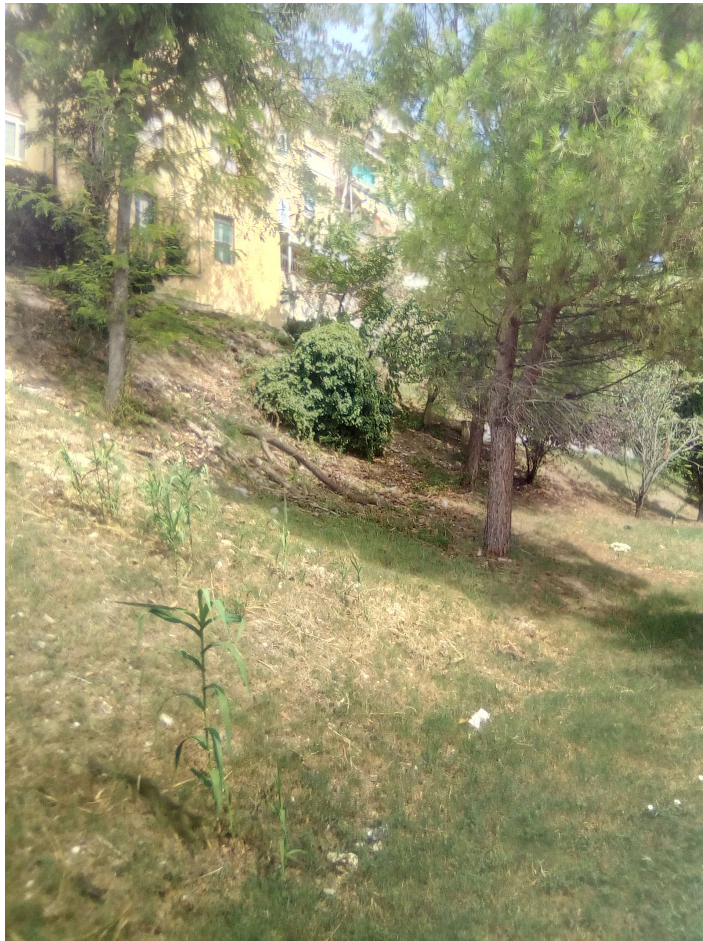
Figura 11: AREA B