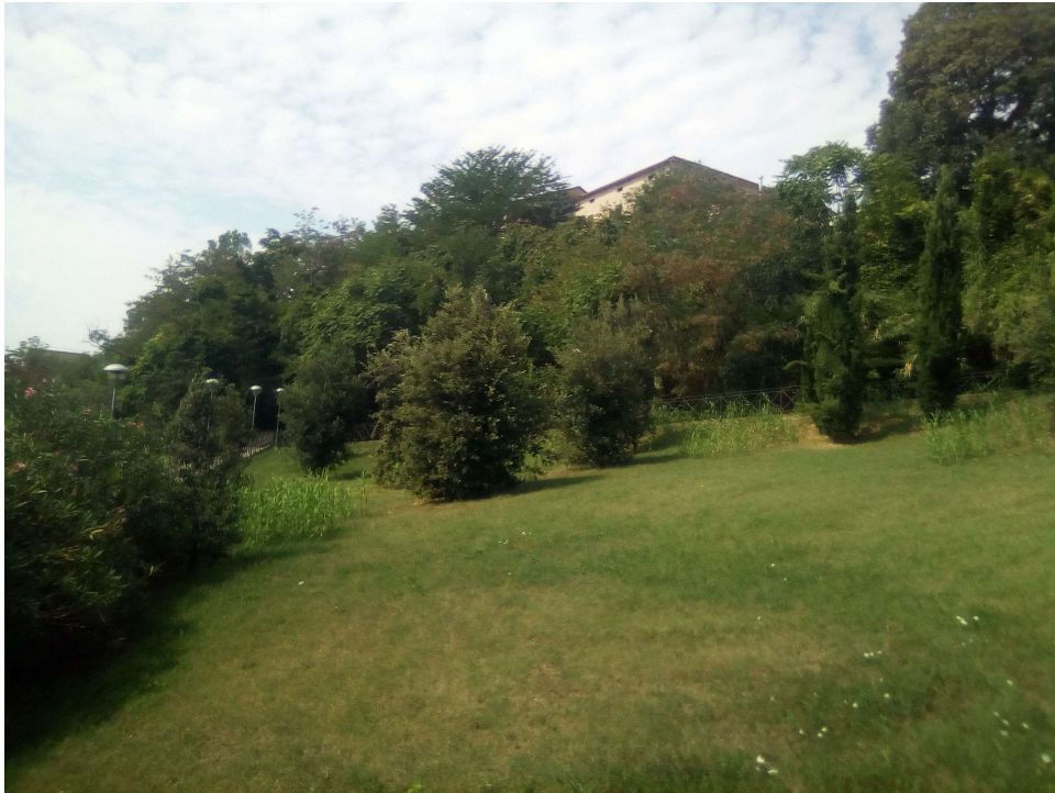
Figura 7: AREA A