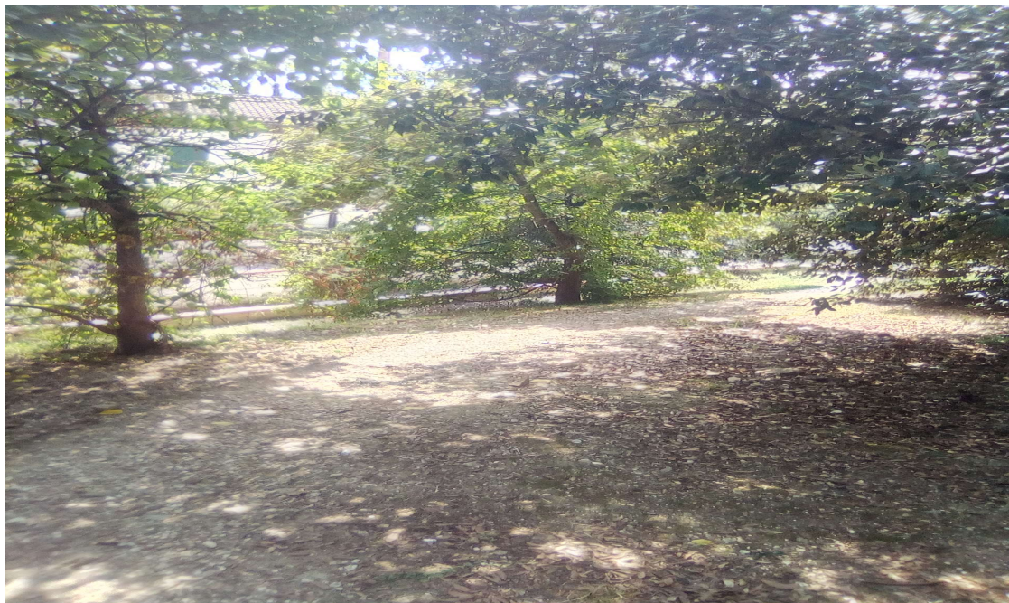
Figura 12: AREA B