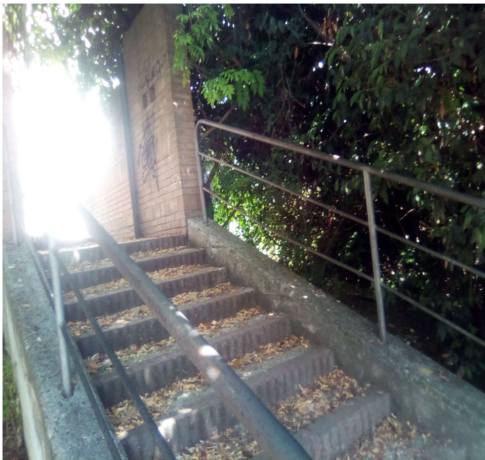
Figura 14: AREA B