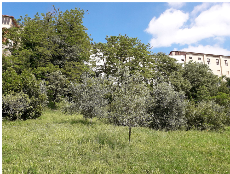
Figura 2: AREA A