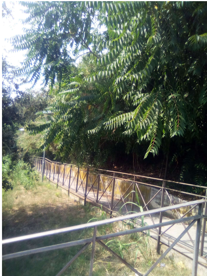
Figura 8: AREA A