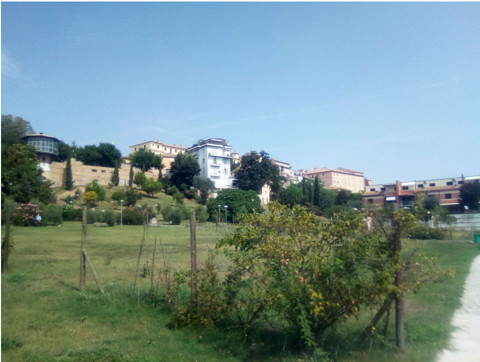
Figura 6: AREA A